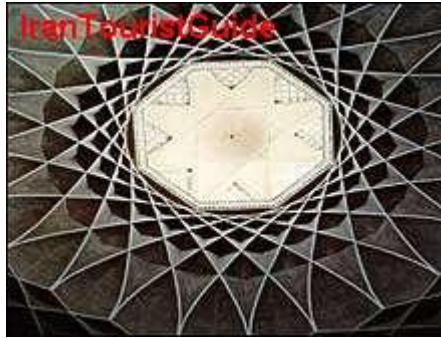
شکل ۱-۲ یک اثر معماری

گاه برای نشان دادن یک دستگاه، شیء یا رویداد، تنها از عکس می‌توان کمک گرفت. هرگاه جزء خاصی از عکس مورد نظر است، باید به‌گونه‌ای تهیه شود که اجزای فرعی چشمگیرتر از جزء مورد نظر نباشد. (شکل ۱-۲)