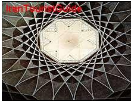
شکل ۱-۲ یک اثر معماری

گاه برای نشان دادن یک دستگاه، شیء یا رویداد، تنها از عکس می‌توان کمک گرفت. هرگاه جزء خاصی از عکس مورد نظر است، باید به‌گونه‌ای تهیه شود که اجزای فرعی چشمگیرتر از جزء مورد نظر نباشد. (شکل ۱-۲)