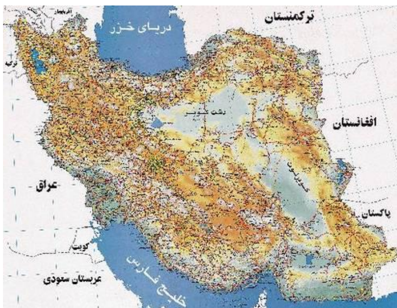
نقشه ۱-۲ نقشه ایران

باید تا حد امکان از به‌کاربردن صفحه‌های بزرگ مانند نقشه‌ها در پایان‌نامه خودداری شود و آنها را از طریق رونوشت‌های (فتوکپی‌های) مخصوص در اندازه تعیین شده تهیه کرد. در صورت لزوم باید به دقت صفحه مورد نظر را داخل پایان‌نامه طوری تا نمود که لبه آن از دیگر صفحه‌ها بیرون نزند.